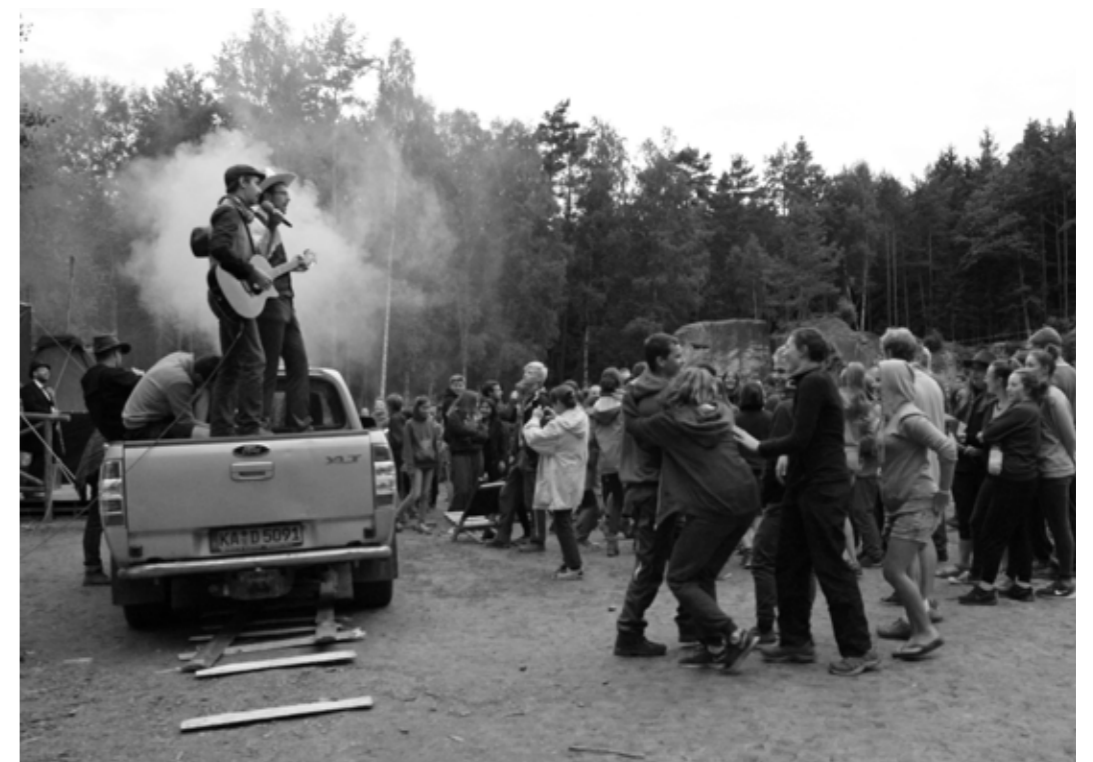
Nachdem die Eisenbahn in Daisy Town eingefahren ist, feiern die Bewohner mit Gesang und Tanz.

Die Mühe hat sich gelohnt: Am Abend kam sie schließlich an, die erste Eisenbahn in Daisy Town. Im Gepäck: Ein ganz neuer Gleisanlagenbetriebsstandhaltungsübereinkunftsbe-