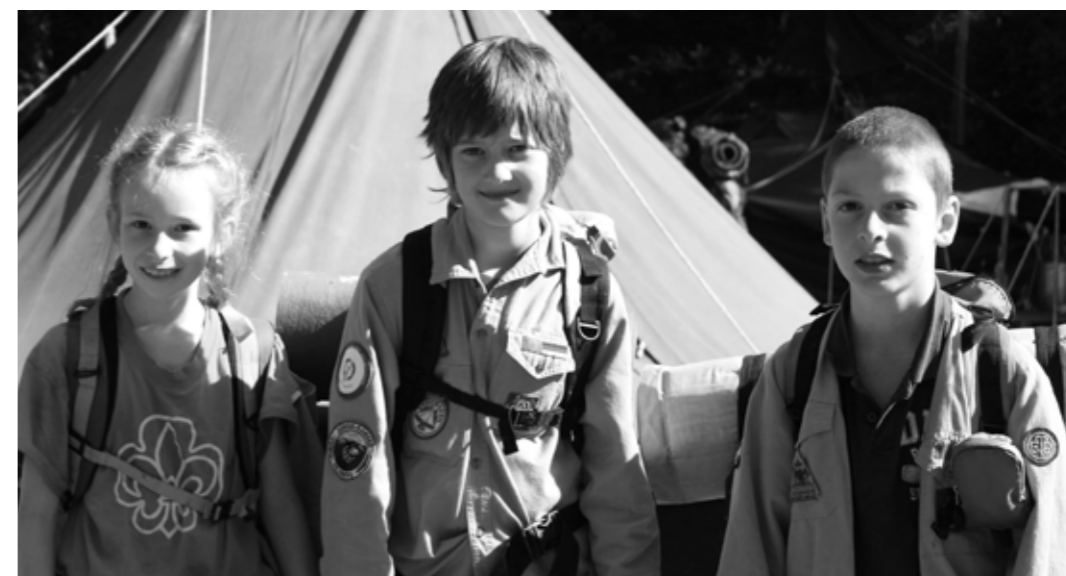
Die Hajkgruppen haben viele Geschichten von ihren Wanderungen mitgebracht.

Die Nacht erstreckt sich wie eine Sternendecke über das Land. Es ist so lau, dass man draußen schlafen kann. Doch dann durchbrechen Lichtstrahlen die dunkle Nacht, ein Auto nähert sich. Langsam fährt es immer wieder am Rastplatz der Hajker vorbei, drei Menschen sind schemenhaft erkennbar. Es steigen zwei Männer aus und nähern sich langsam der Pfadfindergruppe, mehrere Gegenstände in den Händen. Nein, es handelt sich hier nicht um das Drehbuch für einen neuen Krimi, sondern um die Begegnung zwischen beherzten Tierschützern, die schlafende Hornissen aussetzen möchten, und einer Hajkgruppe. Und dies war nicht die einzige Geschichte die sich von Montag auf Dienstag ereignete, denn die Pfad-