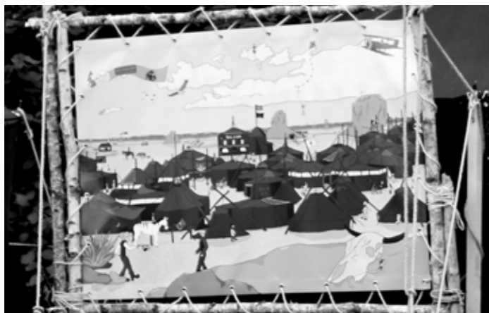
Es wimmelt auf dem Riesenbild am Town Center. Aber nicht alle Figuren wurden schon gefunden.

In unserem Daisy Town geht es nämlich bunt zu, hier treffen allerlei Menschen aufeinander, seien es Pfadis, Cowboys oder gar Aliens! Habt ihr schon das Ufo gesehen? In dieser Stadt geschehen die seltsamsten Dinge: Fische können fliegen, Frau Holle besucht den Wilden Westen und die Pfadfinder haben Solarplanen entwickelt. Die Sanitäter werden wohl auch schon bald zum Einsatz kommen, denn in einem